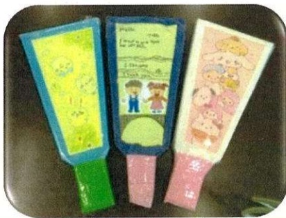
手作りのダンボール羽子板！