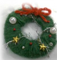
かわいい作品がたくさん！