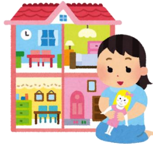
シルバニアファミリー